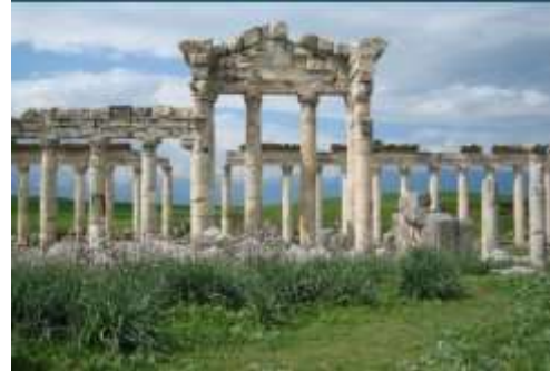
رواق أفاميا المُعمد