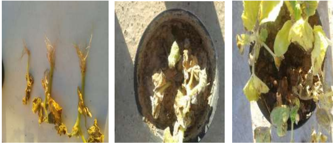
الصورة 3. أعراض الإصابة بمرض الذبول الفوزاريومي في الخيار بعد 30 يوماً من الإعداد الاصطناعي بالفطر الممرض Fusarium oxysporum f. sp. cucumerinum

ويتفق ذلك مع الدراسات التي تشير إلى توفر 3 طرز فيزيولوجية من الفطر المذكور منتشرة في مناطق جغرافية متباعدة، وقادرة على كسر مقاومة بعض الأصناف بدرجات مختلفة (Armstrong et al. , 1978). فيما لم يثبت وجود مثل هذه الطرز في الفطر Fusarium oxysporum f. sp. radicis-cucumerinum وإنما رصد اختلافات مهمة في مدى قابلية بعض أصناف القرعيات للإصابة به (Punja and Parker, 2000).