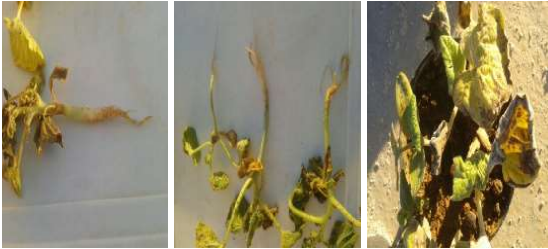
الصورة 5. أعراض الإصابة بمرض عفن الجذور والساق في البطيخ الأصفر (لاحظ تعفن وتقرح لحاء الساق والجذور)