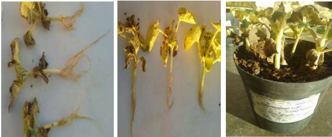
الصورة 6. أعراض الإصابة بمرض عفن الجذور والساق في الكوسا (لاحظ تعفن وجروح لحاء الساق والجذور)