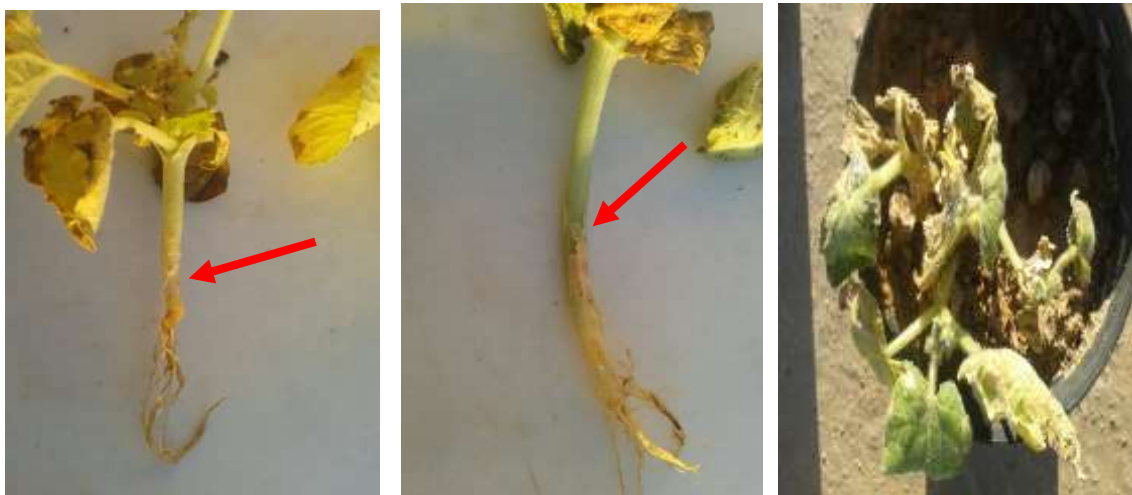
الصورة 4. أعراض الإصابة بمرض عفن الجذور والساق في الخيار (لاحظ تعفن وتقرح لحاء الساق والجذور)